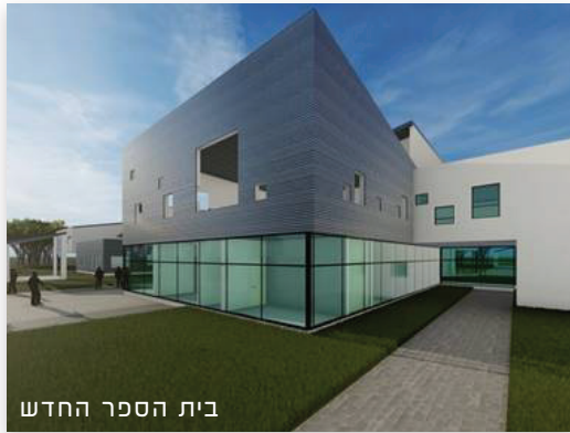
בית הספר החדש

בחרנו להציג בפניכם שבעה מהפרויקטים המרכזיים והמשפיעים ביותר, כאלה שמסמנים את הדרך לעתיד מבטיח ומתקדם.