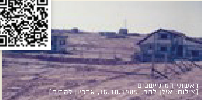
ראשוני המתיישבים